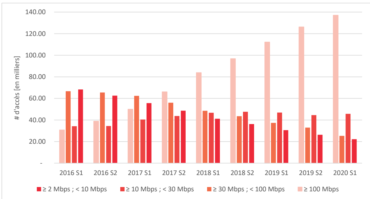
Figure 3 – Nombre d'accès internet ventilés par débit